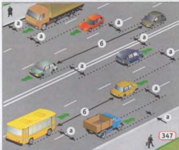
Дистанція та інтервал: а) інтервал, б) дистанція.

13.1. Водій залежно від швидкості руху, дорожньої обстановки, особливостей вантажу, що перевозиться, і стану транспортного засобу повинен дотримувати безпечної дистанції та безпечного інтервалу (мал. 347).